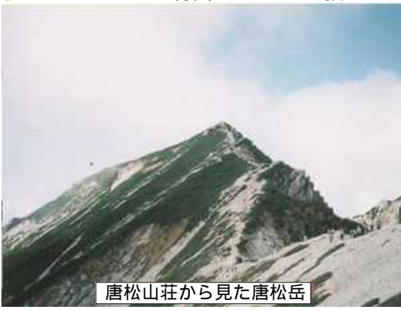
唐松山荘から見た唐松岳

るよ山に、あ、た、八、微、わ、ミ、夏、険、特、ま、い、で、ボ、や、山、用、雪、て、春、る、は、た、場、ク、リン、先、尾、と、も、後、大、と、池、ま、影、マ、映、並、馬、馬、 事そ、庄、安、る、所、に、方、方、で、う、り、ミ、夏、険、特、ま、い、で、ボ、や、山、用、雪、て、春、る、は、た、場、ク、リン、先、尾、と、も、後、大、と、池、ま、影、マ、映、並、馬、馬、 人、二、心、こ、に、唐、松、山、庄、の、登、り、切、つ、き、な、く、フ、ア、 気、分、頂、上、行、へ、お、 い、け、お、